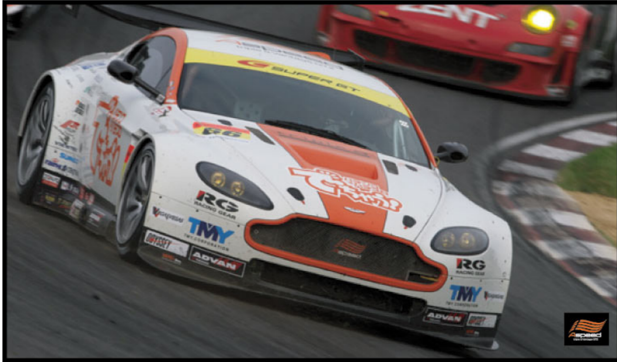
10' SUPER GT SERIES Round 5 (SUGO) 24-25 July, 2010