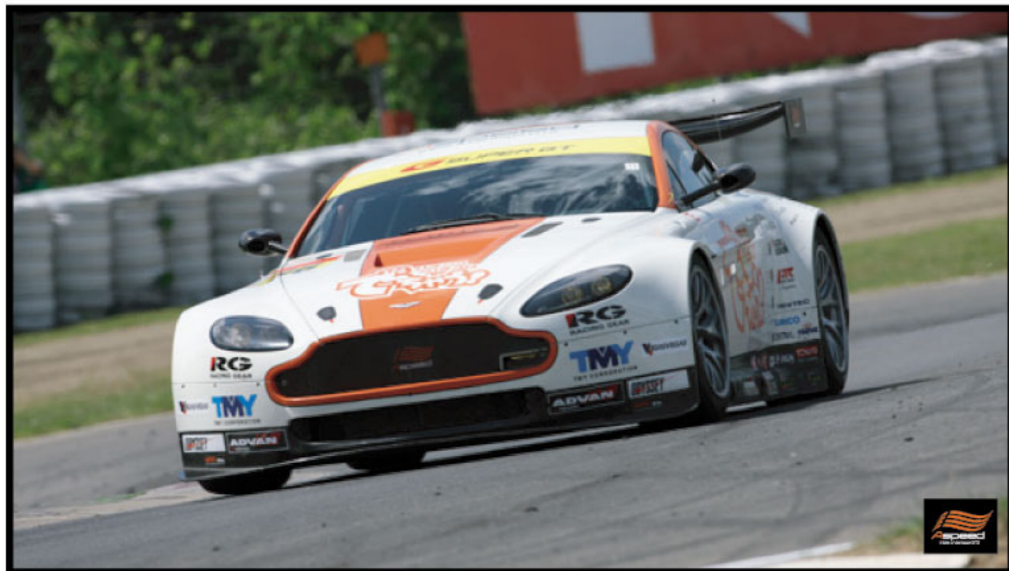
10' SUPER GT SERIES Round 5 (SUGO) 24 25 July, 2010